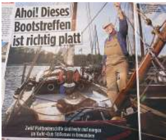
Die Botschafter der niederländischen Bootsbaukunst inspirieren Wassersport und Presse