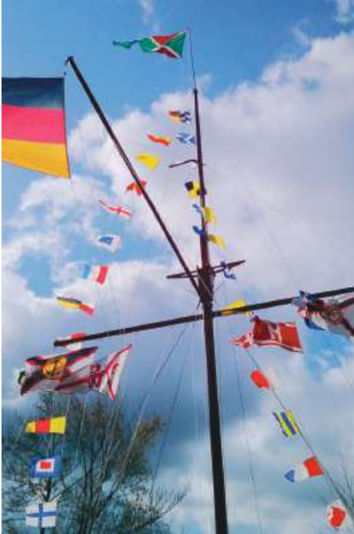
Yacht-Club Stößensee e. V. Flaggenmast