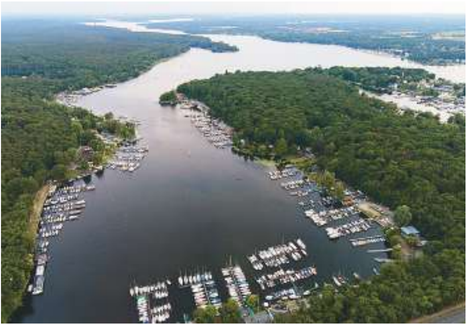
Der Weg ist...